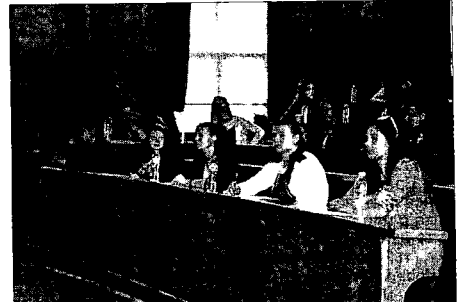
Кандидат-студенти чакат темата на изпита по журналистика в Софийския университет.

формулирани от комисията непосредствено преди изпита. Ще се оценяват уменията за изграждане на цялостен текст, за композиране на изложението, както и общата култура на кандидат-студентите. Плюс ще са показано богатство на езика и оригиналност. (24 часа)