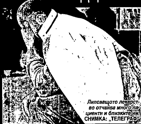
Липсващото лекарство отчайва много пациенти и близките им.