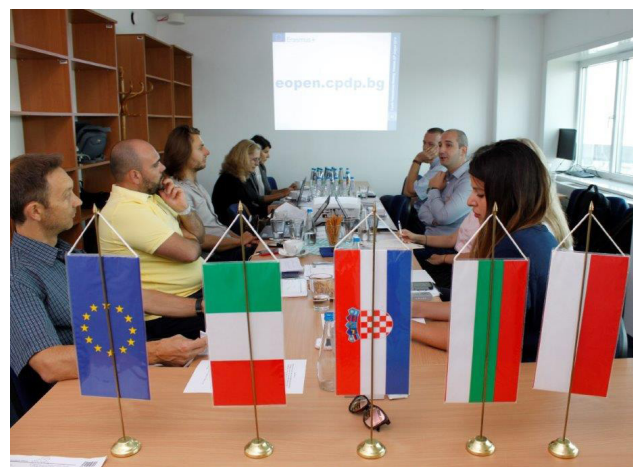
Домакин на последната, четвърта среща (20 август 2019 г.) бе полският орган за защита на личните данни

В периода 13 – 17 май 2019 г. се проведе краткосрочното обучение за служители на партньорите по проект „e-OpenSpace”. По покана на водещия партньор по проекта – Комисията за защита на личните данни, взеха участие представители на всички партньори на проектното начинание. Участниците бяха запознати в детайли с разработените по проекта интелектуални продукти: „Каталог на добрите практики в сферата на неформалното обучение на възрастни”; „Насоки за електронно осъществяване на неформални дигитални обучения в сферата на защитата на личните данни”; „Общ учебен план” и отворените образователни ресурси за неформално дигитално обучение по защита на данните към него; „Методология за валидиране на резултатите от проведеното неформално дигитално обучително съдържание в сферата на защита на личните данни”.