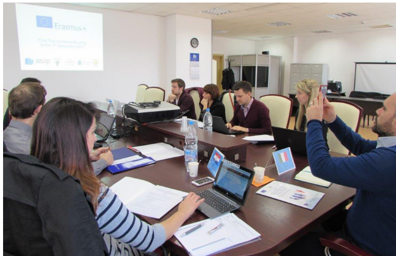
Домакин на първата среща, проведена през декември 2017 г. бе Комисията за защита на личните данни

Втората международна среща бе организирана от Хърватската агенция за защита на личните данни и се проведе на 5 юни 2018 г. в гр. Загреб.