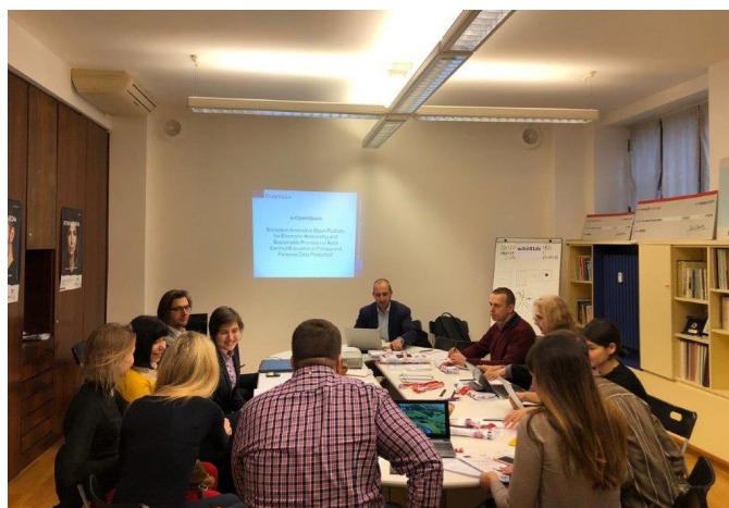
Организатор на третата среща (януари 2019г.) бе италианската неправителствена организация GVMAS