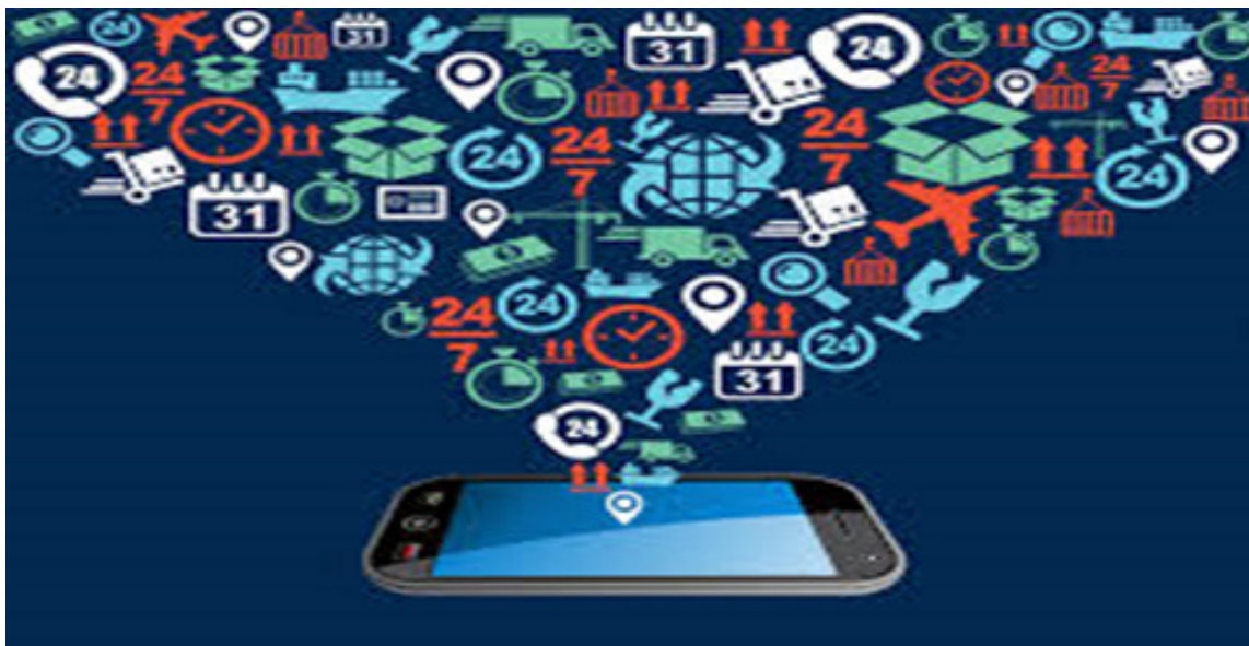
Фиг. 5 Мобилни приложения

Мобилно приложение е компютърна програма, предназначена да работи на смартфони, таблетни компютри и други мобилни устройства. Приложенията, обикновено са достъпни чрез платформи за разпространение на приложения, които започнали да се появяват през 2008 г. и обикновено се експлоатират от собственика на мобилната операционна система, като например Apple Store, Google Play, Windows Phone Store и BlackBerry App World. Някои приложения са безплатни, а други трябва да бъдат закупени.