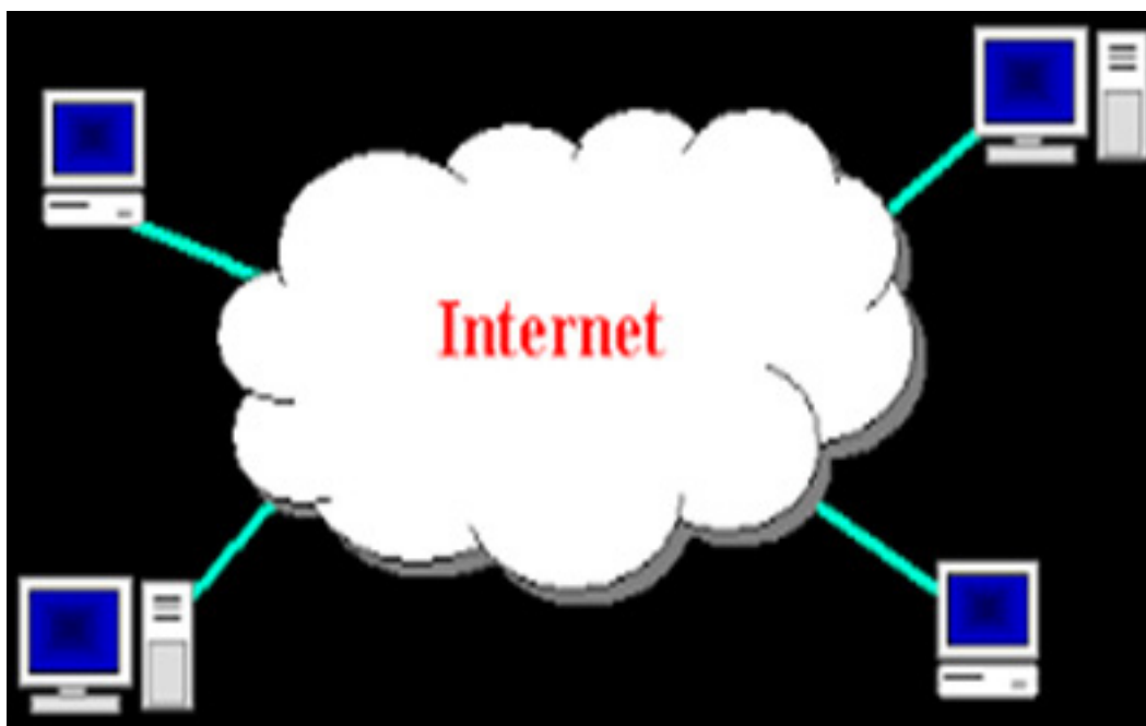
Фиг. 1 Интернет

Информационната инфраструктура, технологичните възможности и услугите, изграждащи и предоставяни от Интернет, са в основата на Йерархичния технологичен модел в цифровия свят.