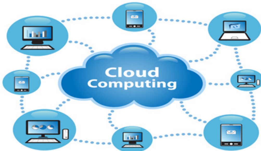
Фиг. 2 Работа в облака