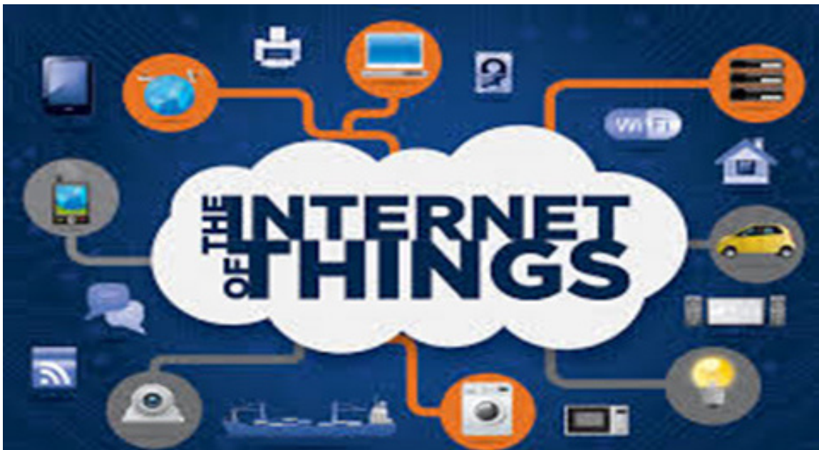
Фиг. 3. Интернет свързани устройства

Развитието на Internet of Things се описва с: