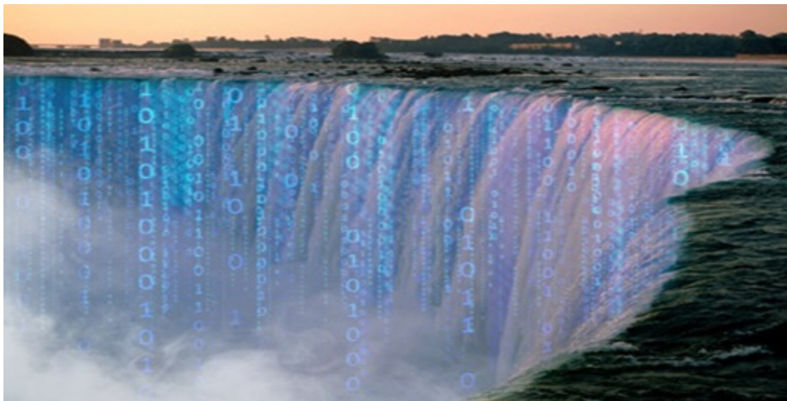
Фиг. 6 Големите данни